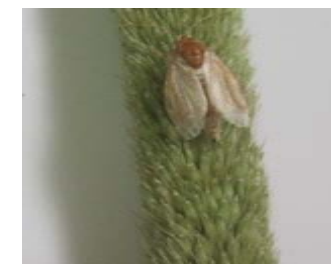
Heliocheilus albipunctella Adulte mâle