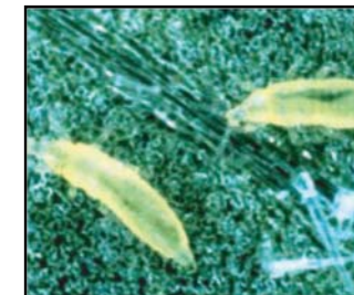
Larve de Thrips tabaci