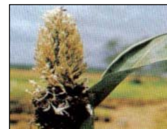
Charbon de la panicule