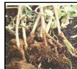
Fonte de semis