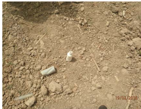
Photo 5 : Emballages vides de pesticides abandonnés dans les champs

Le tableau 15, donne les pesticides que nous avons retrouvés lors des visites de terrain.