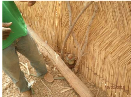
Photo 4 : Reste de pesticide gardé dans le champ près d'un enclos.