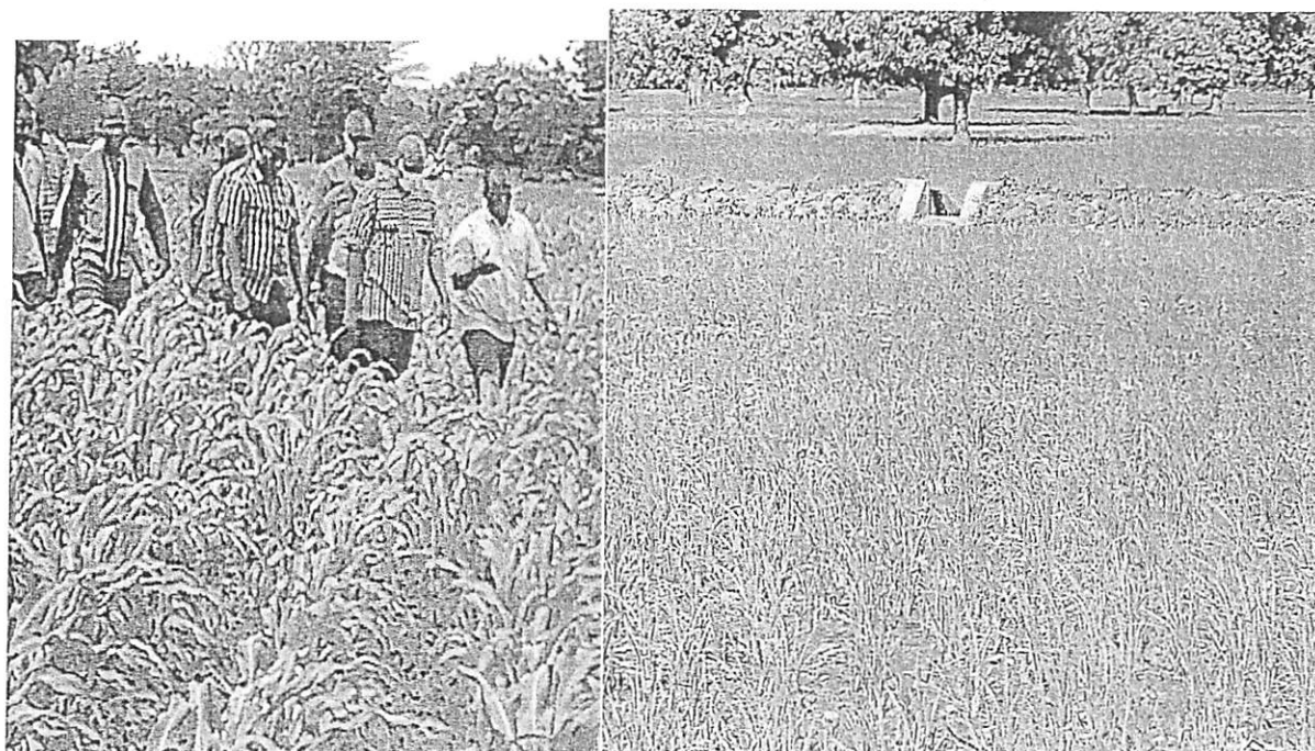
Physionomie de la campagne agricole dans la région du Nord

ANNEXES : quelques images de la campagne agricoles dans les régions du Nord, du Centre-Nord, de l'Est et du Centre Est