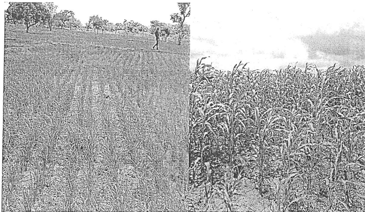
Physionomie de la campagne agricole dans la région du Centre-Est