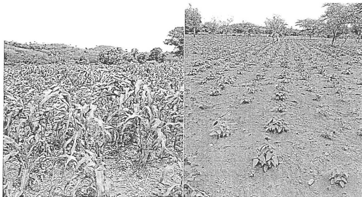
Physionomie de la campagne agricole dans la région du Centre-Nord (site exploité par les PDIs et leurs hotes)