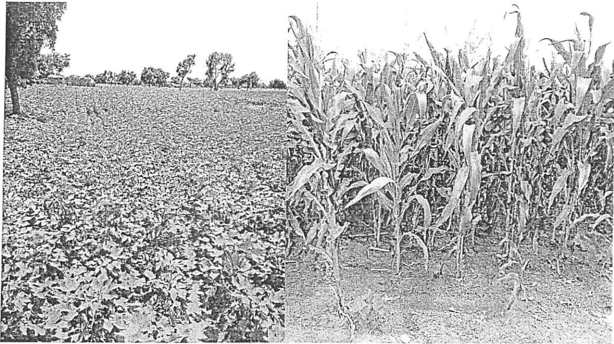
Physionomie de la campagne Agricole dans la région de l'Est