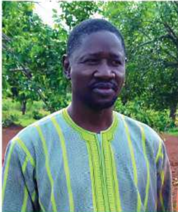
Pr. Alkassoum MAÏGA

Ministre de l'Enseignement Supérieur, de la Recherche Scientifique et de l'Innovation