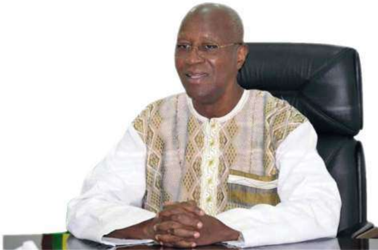
S.E.M. Christophe Joseph Marie DABIRE , Premier Ministre Chef du Gouvernement

« Dans le domaine de la production agro-sylvo-pastorale, halieutique et faunique, nous voulons bâtir un secteur productif assurant la sécurité alimentaire, davantage orienté vers le marché et créateur d'emplois décents,