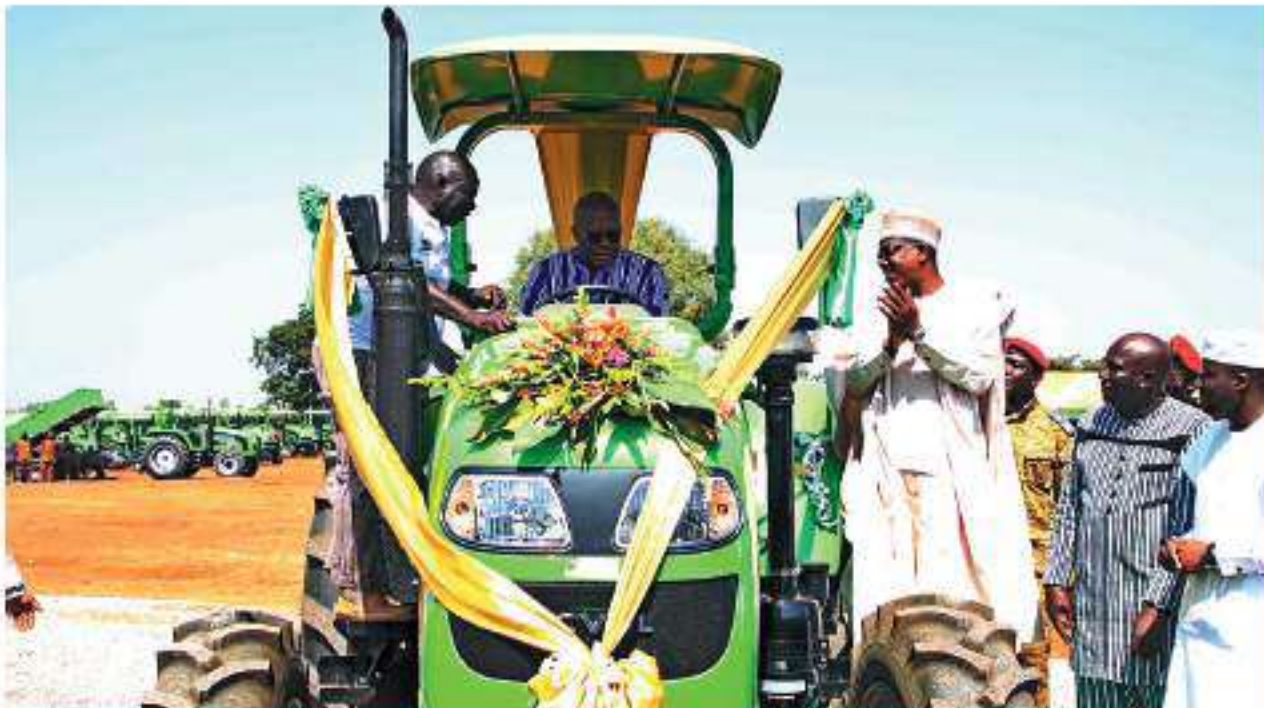
Son Excellence Monsieur Roch Marc Christian KABORE Président du Faso, Chef de l'Etat

« Le Burkina Faso détient un avantage comparatif qui n'est pas pleinement exploité dans les domaines des céréales et des oléagineux, des fruits et des noix, et dans celui de l'élevage. Ces opportunités importantes permettront de diversifier la production agricole et les exportations , dans le but d'améliorer la soutenabilité, de promouvoir une transformation structurelle et, en définitive, de créer davantage de valeur ajoutée.