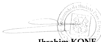
Ibrahim KONE Chevalier de l'Ordre de l'Étalon