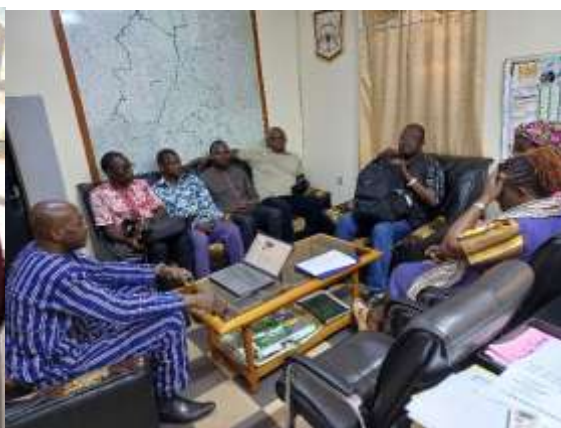
Echanges avec le DR de l'agriculture Hauts-Bassins le 12/06/2025 Echange avec le DR de l'agriculture Boucle du Mouhoun le 11/06/2025