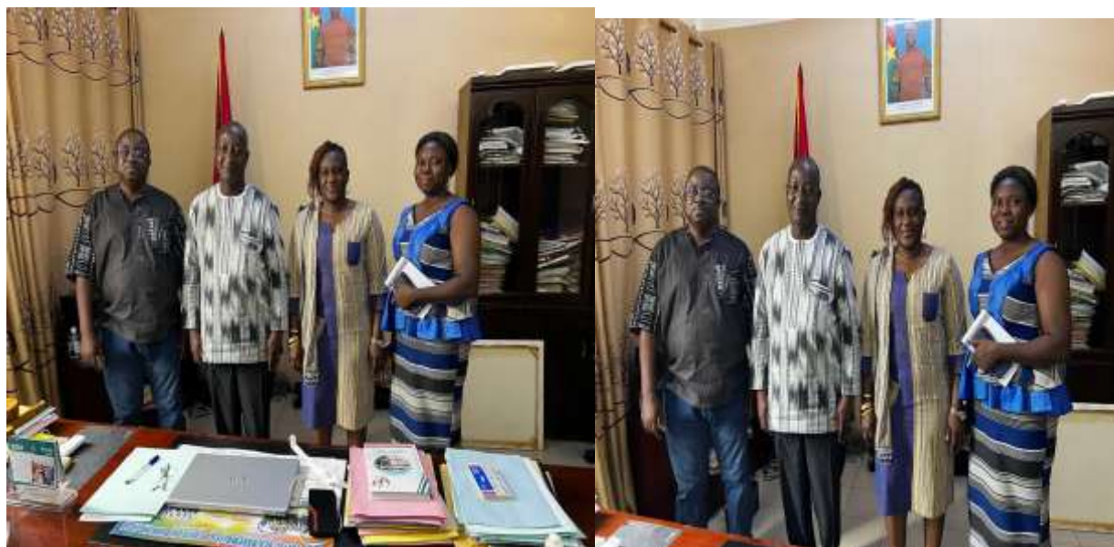
Échanges avec le PDS de Koudougou, 10/06/2025, Koudougou