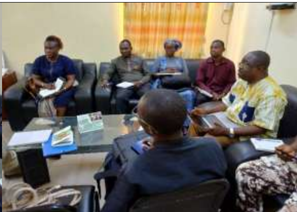
Echanges avec le Directeur régional de l'agriculture du Centre Ouest le 09/06/2025