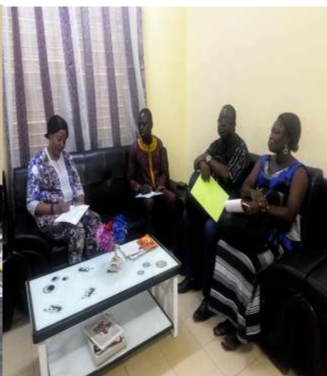
Échanges avec le Secrétaire Général du Haut Commissariat, 10/06/2025, Koudougou