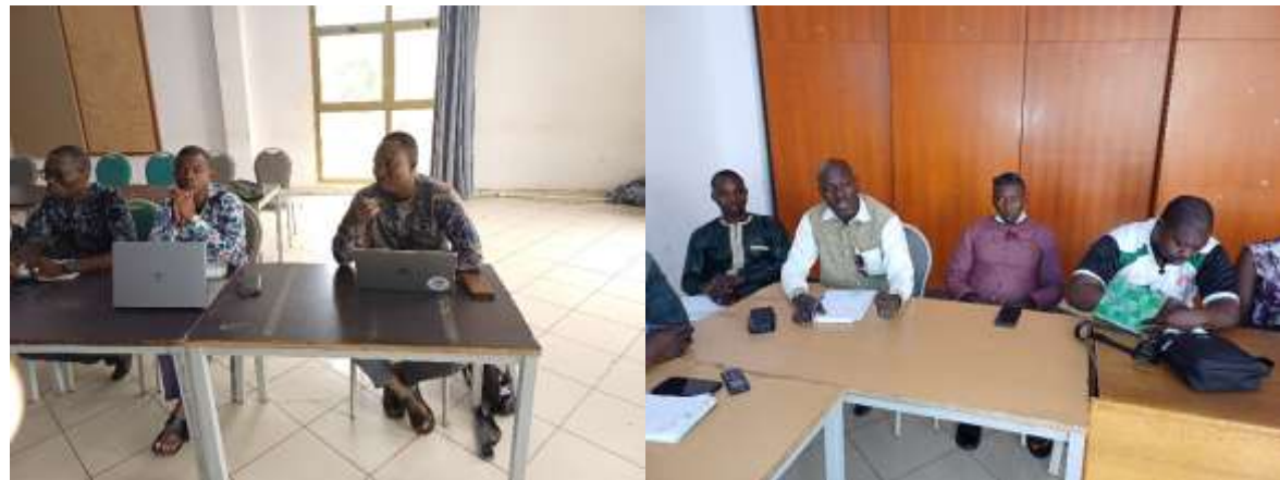
Echanges avec les participants de la région des Hauts-Bassins le 12/06/2025