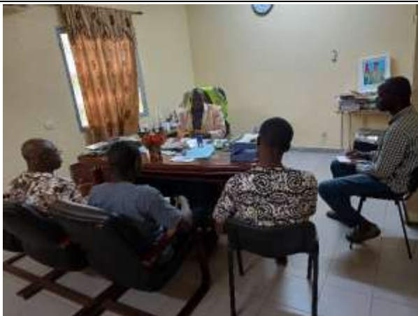
Echange avec le Directeur Régional du commerce et de l'industrie