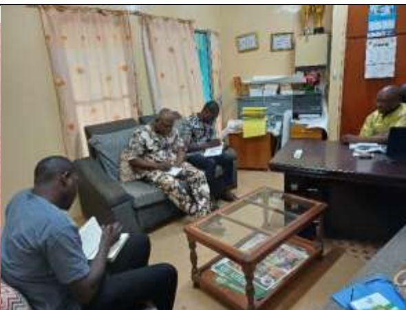
Echange avec le DR environnement : eau et forêts du Centre Ouest