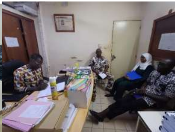
Echange avec le représentant du DR de la DREP