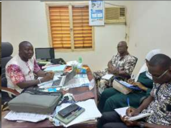
Echange avec le représentant du DR eau et assainissement