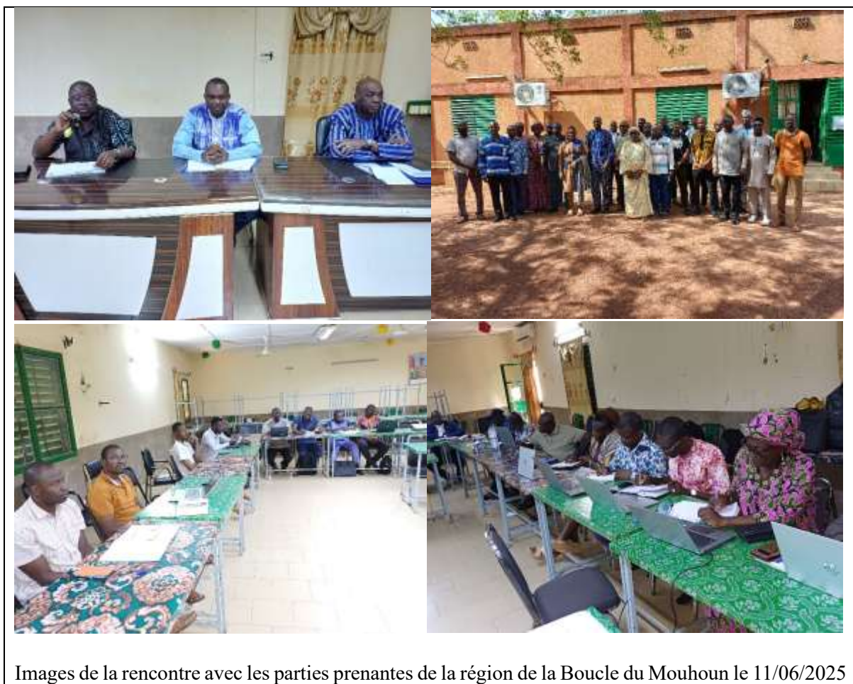
Images de la rencontre avec les parties prenantes de la région de la Boucle du Mouhoun le 11/06/2025