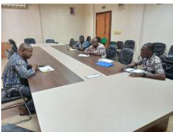
Rencontre avec le DR de l'action humanitaire centre Ouest